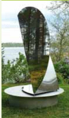
Metamorphosis 2 Kari Huhtamo

Mikkeli Puiston kesä 2009 tarjoaa tätä kaikkea; kohteeseen luotua ympäristötaidetta sekä kansainvälisten taiteilijoiden luomia teoksia, jotka luontoon sijoitettuina saavat uudenlaista syvyyttä ja merkitystä. Tervetuloa tutustumaan ja kuuntelemaan, millaisia ajatuksia teokset juuri Sinussa herättävät.