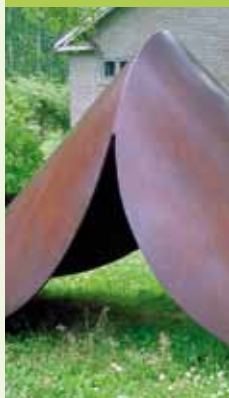
Monolinear planes, junction Lucien den Arend

Mikkeli Puiston kesä 2009 tarjoaa tätä kaikkea; kohteeseen luotua ympäristötaidetta sekä kansainvälisten taiteilijoiden luomia teoksia, jotka luontoon sijoitettuina saavat uudenlaista syvyyttä ja merkitystä. Tervetuloa tutustumaan ja kuuntelemaan, millaisia ajatuksia teokset juuri Sinussa herättävät.